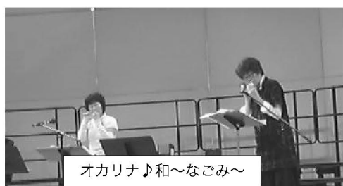
オカリナ♪和〜なごみ〜