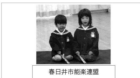
春日井市能楽連盟