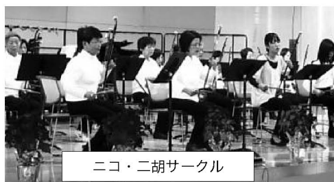
ニコ・二胡サークル