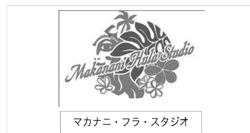
マカナニ・フラ・スタジオ