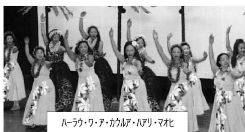
ハラウ・ワ・ア・カウルア・ハアリ・マヒ