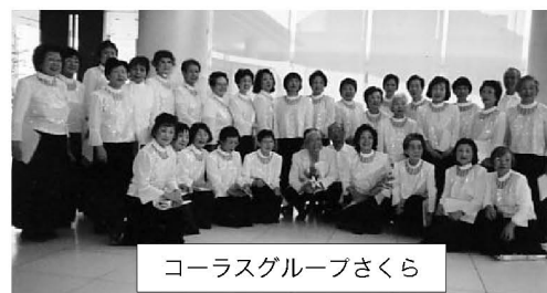
コーラスグループさくら