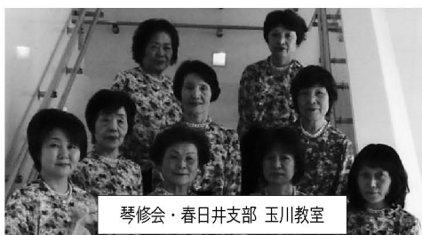
琴修会・春日井支部 玉川教室