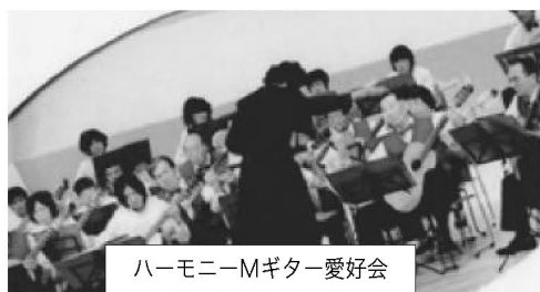
ハーモニーMギター愛好会