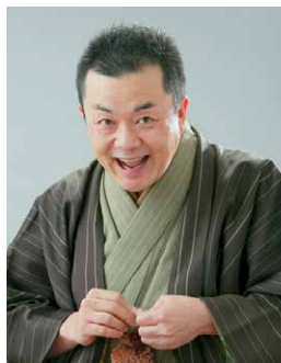
* なるみ家笑天 Narumiya Shoten 社会人落語「楽語の会」

※上記のアーティストより1か所につき1～4名を派遣します。 ※このほかにも春日井にゆかりのある方を中心に派遣先とご相談の上、 派遣アーティストを決定します。